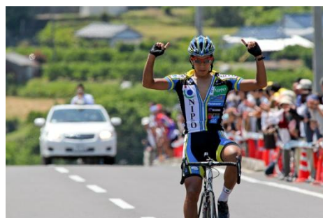
エ. 5月30日(日) 第3ステージ 太地半島周回コース 96km(9.6km x10周)