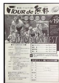
フォトコンテストチラシ