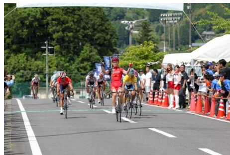
ウ. 5月29日(土) 第2ステージ 熊野山岳コース 118.2km